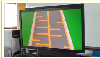
การทดสอบการควบคุมพวงมาลัย