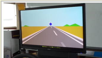
การทดสอบการเลือกตอบสนอง