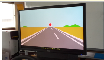
การทดสอบปฏิกิริยาอย่างง่าย

การทดสอบความถนัดในการขับขี่แบบ N ผลิตภัณฑ์ที่ได้ตามมาตรฐานของเครื่องทดสอบความถนัดสำหรับผู้เรียนสูงวัยในประเทศญี่ปุ่น