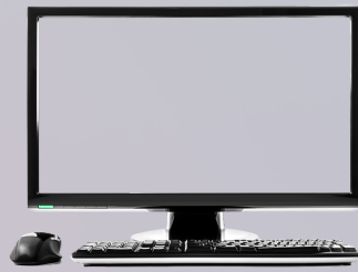
PC ระบบจัดการ

ดูแลด้วยระบบควบคุมสถานะการจัดเก็บไฟล์เตอร์