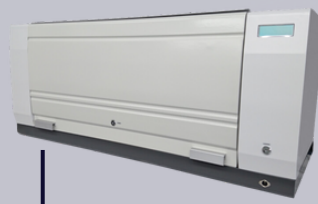
ตัวเครื่อง APS-500A