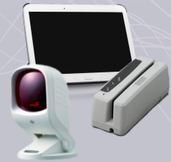
ส่วนอ่านข้อมูล

รุ่น APS-500A สามารถจัดเก็บได้สูงสุดถึง 240 แผ่น